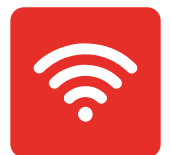
IEEE 802.11 a/b/g/n/ac