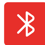
BT 5.0 (BR/DDR+BLE)